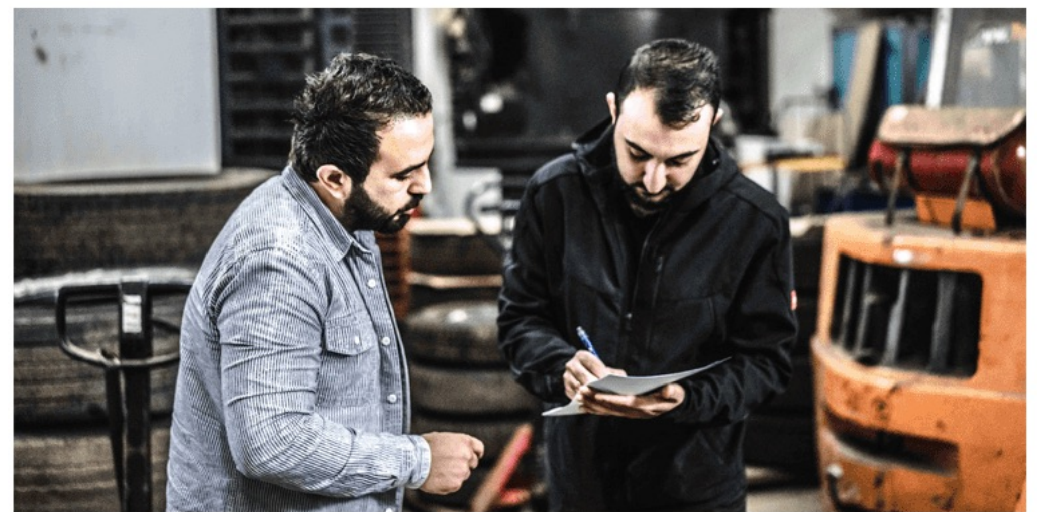
Azubibesuch bei der Firma