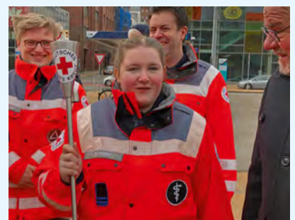
Fackelträger des DRK-Kreisverbands Flensburg-Stadt.

Weitergehende Informationen unter: https://drk.de/fiaccolata2023